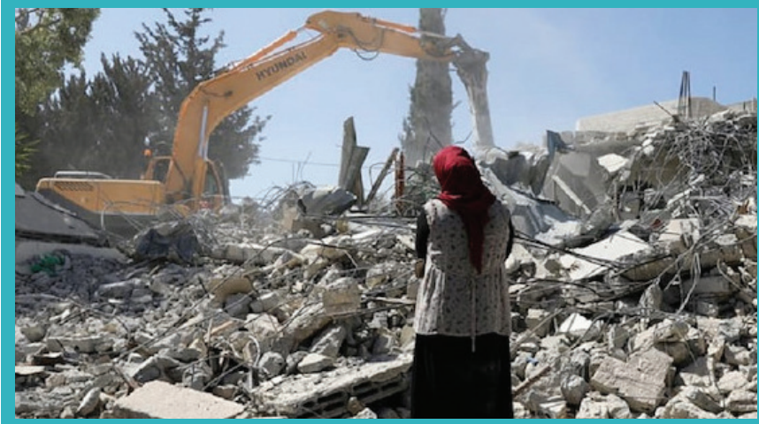
هدم منزل