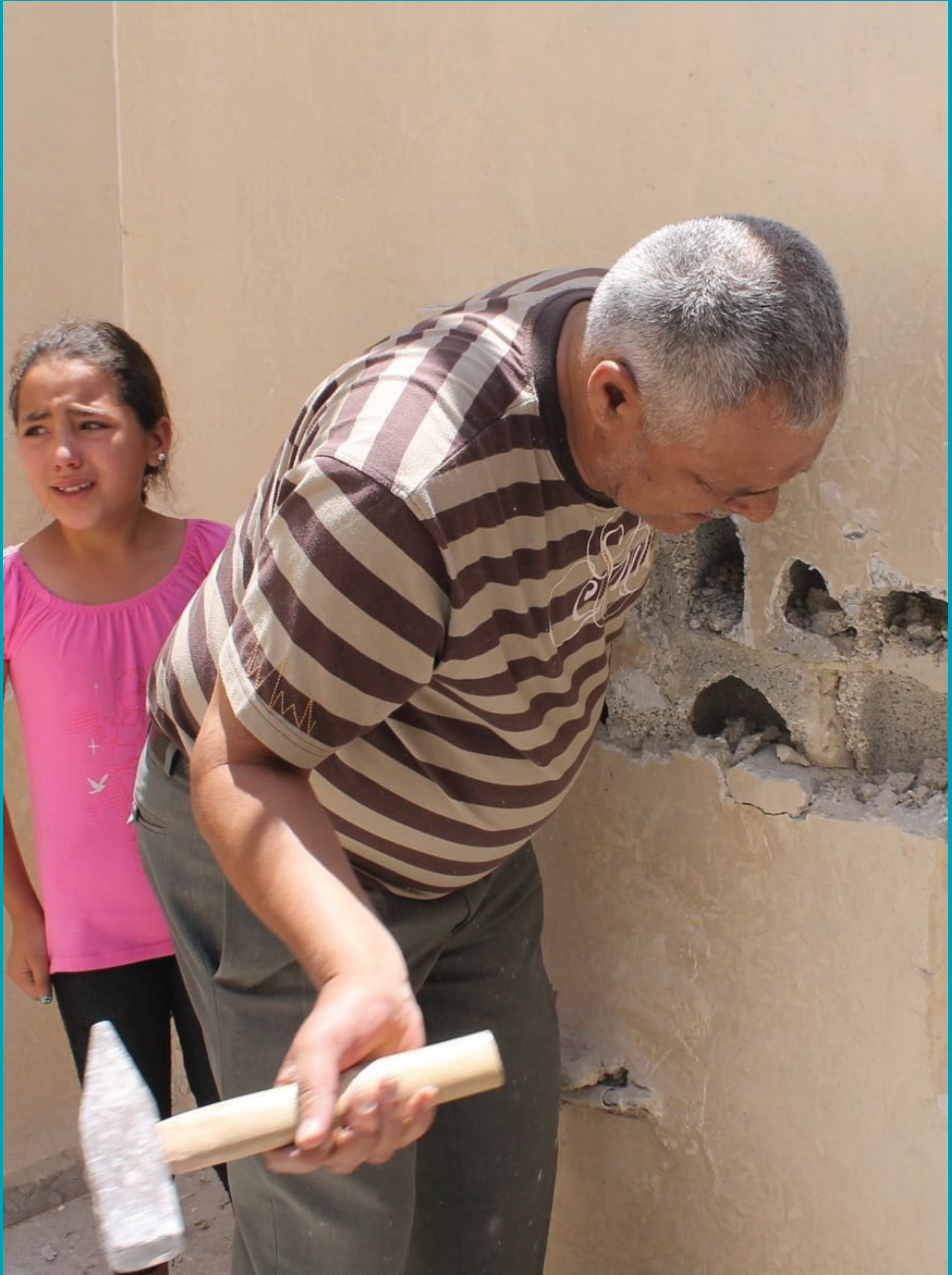
هدم ذاتي لأحد المنازل في القدس