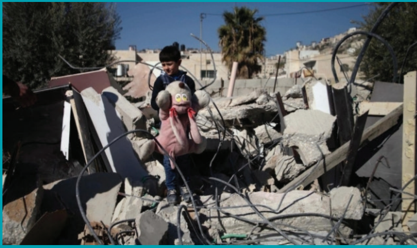
الاحتلال يهدم في سلوان

على الرغم من ذلك، تستمر ولا تزال هذه السياسة قيد التنفيذ، مؤدية إلى تدمير منازل الفلسطينيين والفلسطينيين وتهجيرهم وما له من آثار سلبية مصاحبة عليهم، دون أن يكون لهم ارتكاب أعمال ضد إسرائيل.